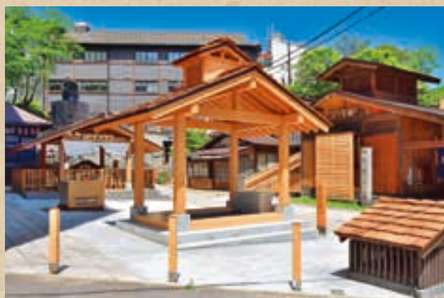
足湯 顔湯 手洗乃湯