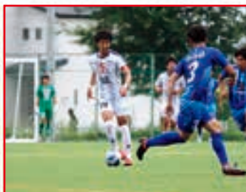
↑(この日キャプテンの功績 真選手)