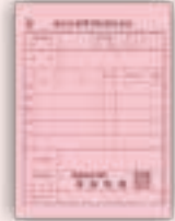
通称：ピンクの医療券

役場 福祉課で支給申請を行って ください。申請翌月にお客様の口 座へお振込みいたします。