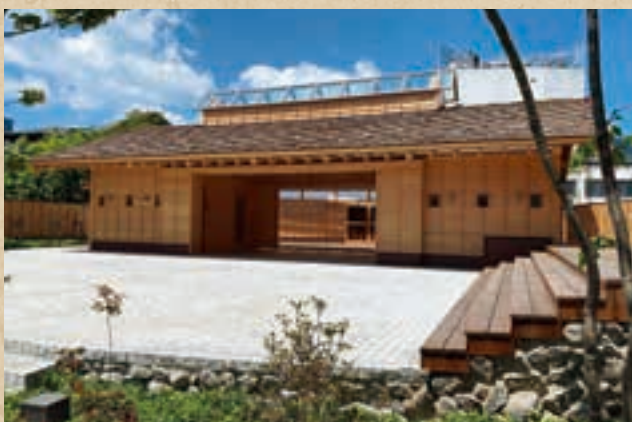
地藏カフェ 月の貌