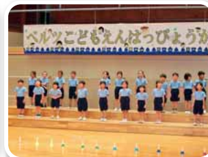
ハンドベル「星に願い を」合唱「YUME日和」