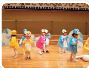
ゆうぎ「ゆきだるまの チャ チャチャ」「ペンギン・ペンギン」