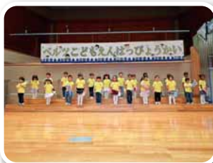
ピアノカ「チューリップ」 合唱「まほうのとびら」