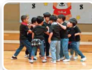
ダンス 「POCK this Party」