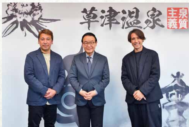
(株)ザスパ 細貝社長（右）と西村監督（左）