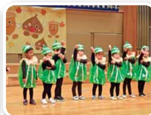
ゆうぎ 「どんぐりマン」