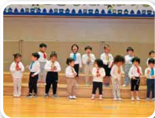
楽器遊び 「手をたたきましょ」 歌「たのしいね」