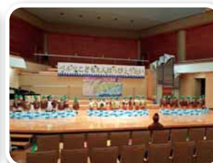
劇あそび 「やさいのおふろ」