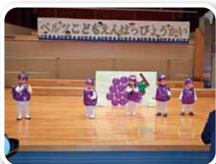
ダンス 「ぼくたち ぶどう」