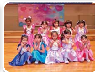
ダンス「かわいいだ けじゃだめですか」