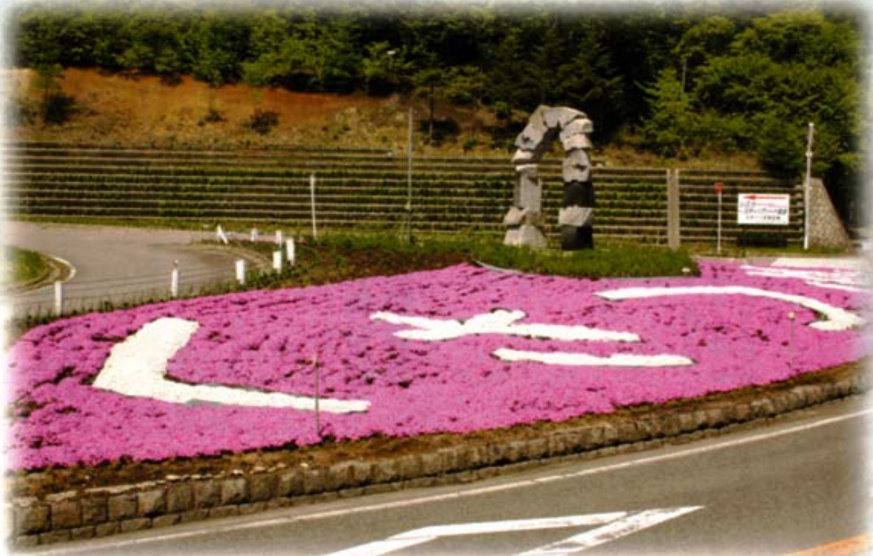
草津町入り口に植栽（芝桜）