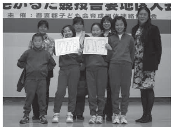
上毛かるた競技吾妻郡大会