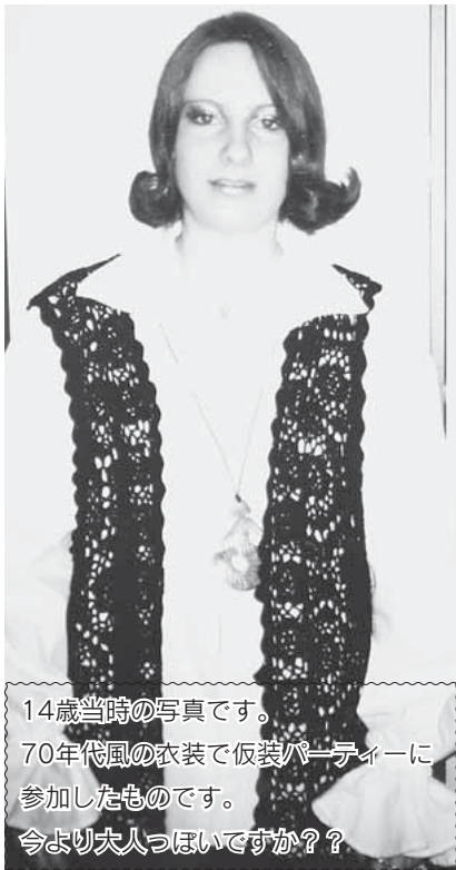
14歳当時の写真です。 70年代風の衣装で仮装パーティーに参加したものです。 今より大人っぽいですか??