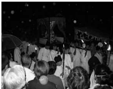
↑〈雨にフラッシュが反射して雪みたいですね〉