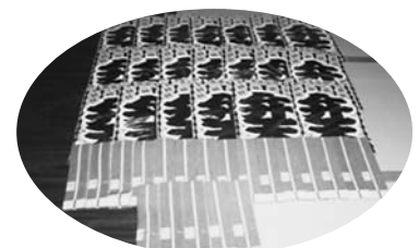
祭りを通じて、地域の人々との つながりが深まります