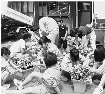
ベルツ通り協議会や立町区 小中学校PTAにより、花 の植栽運動を行いました