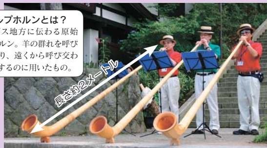
アルプホルンの長さに驚いた!!という観客も。

アルプス地方に伝わる原始的なホルン。羊の群れを呼び 集めたり、遠くから呼び交わ したりするのに用いたもの。