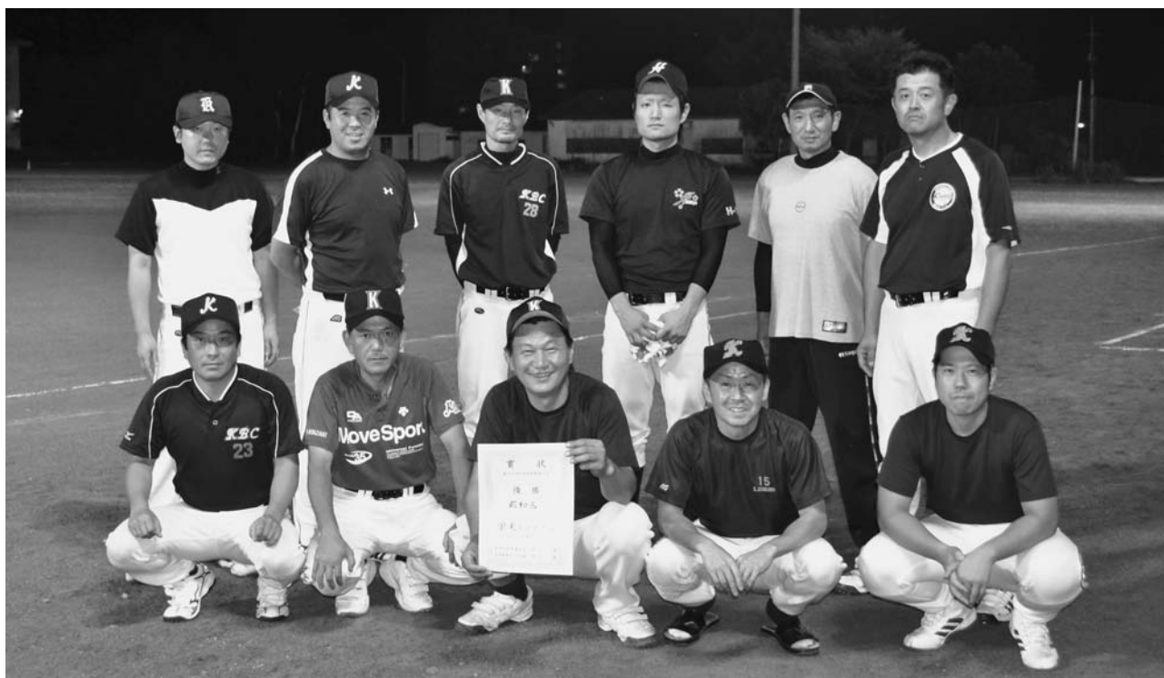
優勝した昭和区チームのみなさん。充実した試合を終えて、皆さん笑顔です。