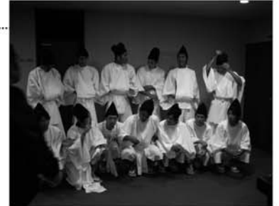
↑【今回は、この13名で参加しました】

8月1日(月)・2日(火)に行われた『第66回草津温泉感謝祭』に、ケガの選手などを除く13名で参加しました。昨年まではステージでチーム紹介をしていたのですが、今回はじめて女神が乗る輿を担ぐ白丁の役目を担いました。白丁の衣装をはじめて着る選手もいて、1日目は着替えに戸惑っていましたが、2日目にはすばやく着替えることができていました。当日は、小雨の降るあいにくの天気でしたが、2日間参加し、とても貴重な経験をすることができました。