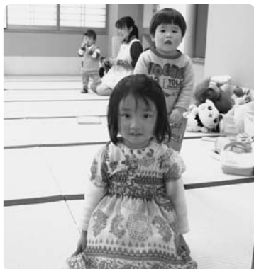
救援物資の子ども服を気に入りに、身につけた女の子。ごく機嫌な表情で写真撮影に応じてくれました。