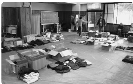
草津町民からいただいた救援物資は、すぐに被災者のみなさんに配布・活用されました。