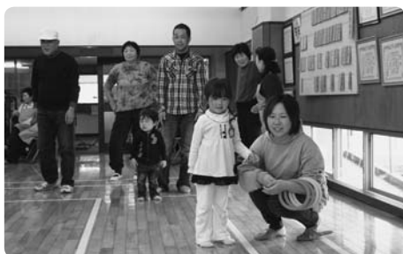
4月28日 南相馬市民との交流会 草津町民との交流も徐々に深まり、和やかな時間を楽しみました。