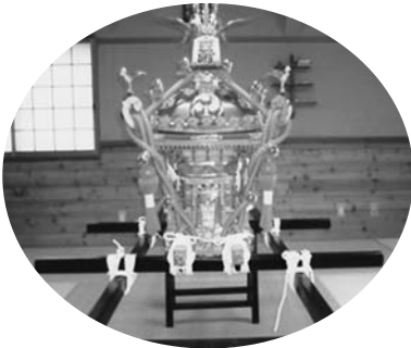
立町区のこども御輿

①公益財団法人群馬県市町村振興協会が、サマージャンボ宝くじ交付金を財源として実施している「魅力あるコミュニティ助成事業」を活用して、立町区の子供御輿・半天20枚・帯20本を整備しました。立町区長は「震災などで大変な時期だが、この事業のおかげで区内にいる被災者の方々と祭を通じて触れ合えてよかった。これからもうこうした活動を充実させていきたい。」と意気込みを語りました。