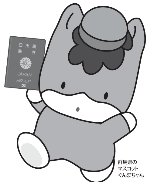
群馬県の マスコット ぐんまちゃん