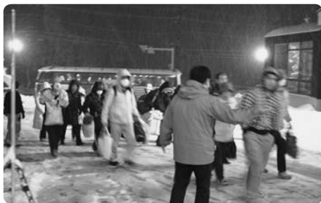
3月25日 南相馬市から被災者約150名が到着。町内の宿泊施設に滞在。