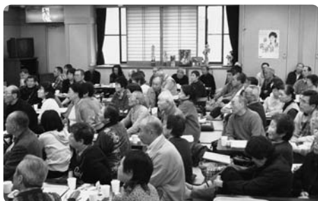
4月8日 南相馬市民との交流会にて、不安な面持ちで南相馬市職員から状況説明を受ける。